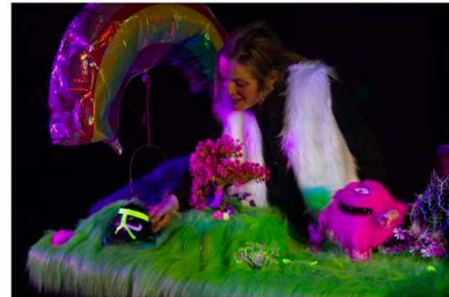
Le monde fluo, l'autre monde