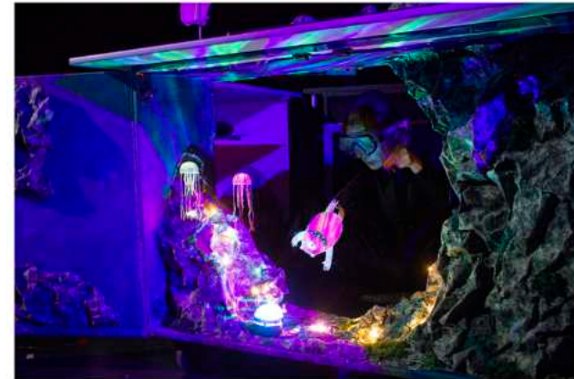
Le monde de la mer