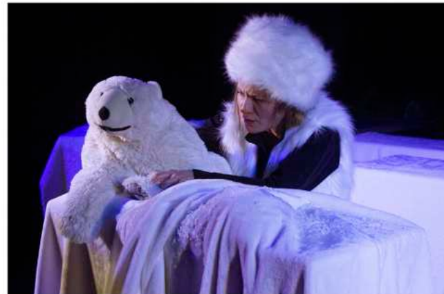
Le monde polaire